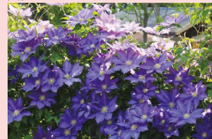
クレマチスガーデン