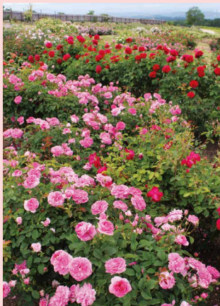
ローズガーデン / 5月下旬～10月中旬

宿根草や花木を中心に彩られた久住ガーデン。300種・ 1500株のローズガーデン、クレマチスとアサギマダラが飛 来するフジバカマを配置したクレマチスガーデン。