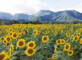
ひまわり / 8月中旬