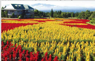
ケイトウ / 9月上旬～10月下旬