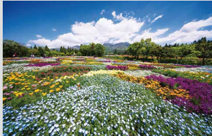
春彩の畑 / 4月下旬～5月下旬