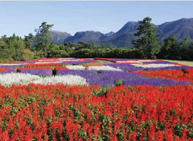
サルビア / 9月上旬～10月下旬