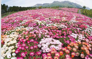
リビングストーンデージー / 4月下旬～5月下旬