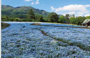
ネモフィラ / 4月下旬～5月下旬