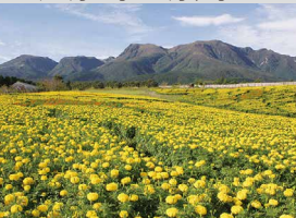
マリーゴールド / 9月上旬～10月下旬